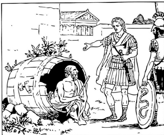
Bild 1. Diogenes och Alexander.

För att ge en illustration av den fria människan brukar man ta det klassiska exemplet »Diogenes i tunnan«. Då Alexander den store hälsade på filosofen Diogenes, som alltså bodde i en tunna, frågade Alexander honom om han hade någon önskan. Diogenes svarade: »Ja, att du stiger åt sidan så att du inte skymmer solen.«