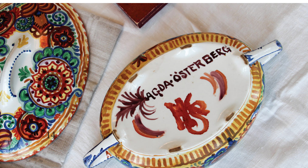
VÄNSTER Denna soppterrin från studieåren i HKS är det tidigaste verk vi har av Agdas hand. Färgglädjen går inte att ta miste på.